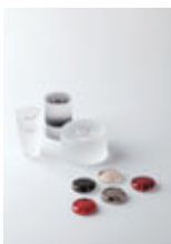
(上) 水引ペーパーウェイト (下) 宵月 (箸置き)

富山市と高岡市との交流・連携事業 「Metal Glass Japan」から生まれた作品 MGJ (エムジーエイ) とは、富山市、高岡市が有するガラス (Glass) や銅器 (金属: Metal)、漆器 (漆: Japan) の頭文字から付けられたプロジェクトです。優れた工芸素材や技術を用いたデザイン性豊かな商品を提案し、地域のものづくりの活性化を目指しています。メンバーは、富山ガラス工房、高岡市デザイン・工芸センターを中心に、富山市、高岡市の作家、職人等で構成。 (MGJの他の作品については、P9をご覧ください。)