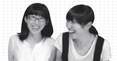
デザイン 有井ゆま・有井ユカ (Style Y2 International Ltd.)