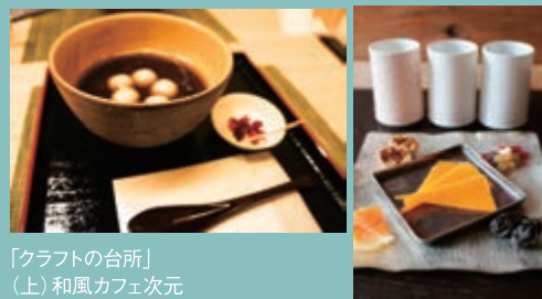
「クラフトの台所」 (上)和風カフェ次元 (右)nousaku

市内のレストランや飲食店で、作家の作品を器として使って料理を出す「クラフトの台所」では、前回の2店舗から10店舗に会場が増え、カフェから和食までメニューも多彩になった。