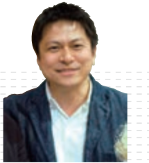
デザイン 大治 将典

サイズ: ○スプーン 大 W36×D190×H13mm 中 W25×D140×H11mm 小 W25×D130×H13mm 素材:鉛レス真鍮 (口に触れる部分は銀メッキ) 価格:(税抜) ○スプーン 大2,600円 中2,300円 小2,200円 ○フォーク 大2,800円 中2,500円 小2,400円 ○ナイフ 3,700円 ※2014年1月末価格