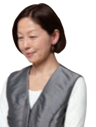
デザイン 磯野 梨影