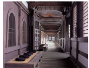
禅堂と回廊(重要文化財)