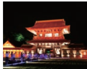
ライトアップされた山門(国宝)