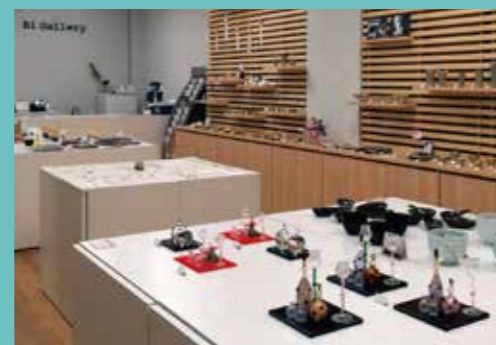
B1ギャラリー 営業時間/10:00~18:00 定休日/火曜 [問] クルン高岡 B1ギャラリー TEL.0766-50-8661

季節ごとに企画展も実施しており、テーマに合わせて作品が出展され、作家の思いが込められたクラフトを日常の暮らしのなかで楽しむ豊かさを提案するギャラリーとなっている。