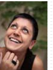
デザイン Sylvie Amar Studio