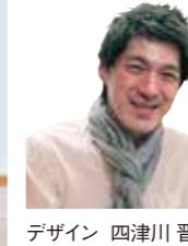
デザイン 四津川 晋