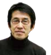
デザイン 株式会社 千葉学建築計画事務所

[問] 三協山株式会社 三協アルミ社 エクステリア事業部 TEL.0766-20-2261