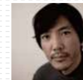
デザイン Caro inc. 山口英文