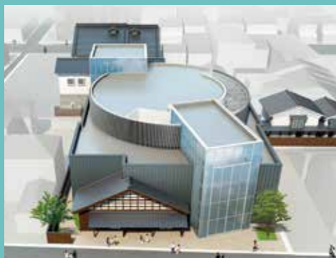
利屋町側外観鳥瞰図(イメージ)