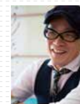
デザイン CEMENT PRODUCE DESIGN

誰でも感じたことがある、むずがゆい背中。富山の基幹産業であるアルミと、高岡銅器がミックスした、スタイリッシュな「孫の手」誕生です。高純度鋳物とポリッシュが、キラリと光る美しい品質。メゾンブランドのような繊細な意匠だけど、どこか片田舎のアルチザンを感じる、力強いデザインが特徴。アルミならではの、軽やかでエレガントな揺ぎ心地です。かゆいところに手が届く佇まい、存分にお楽しみください。