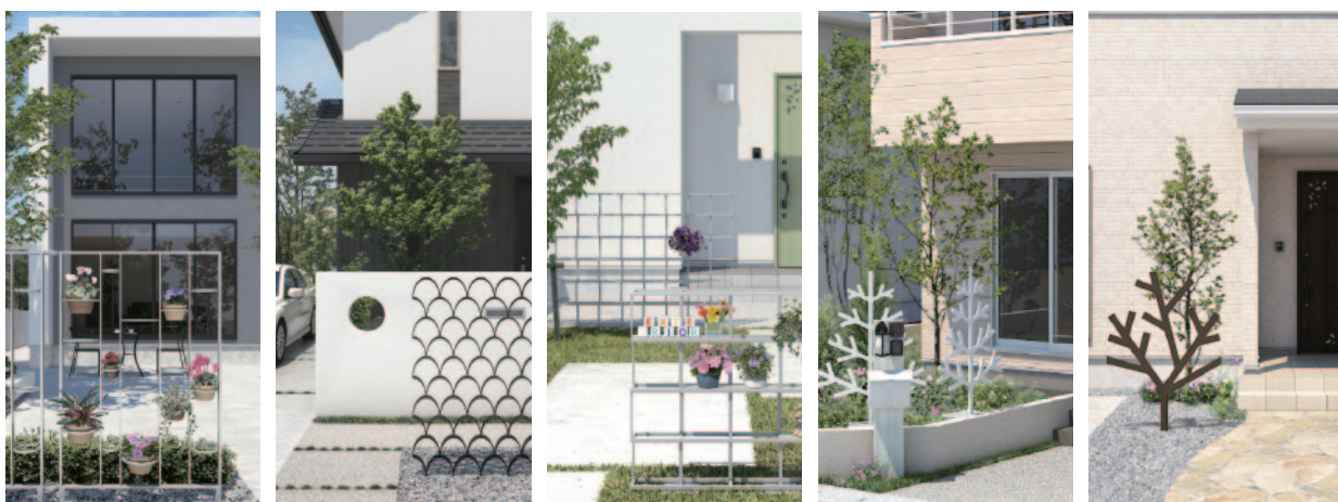
S.Border Series 「RING RING」 「mermaid」 「airblock」 「momi」 「kaede」